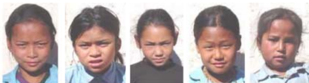
Ttap okmaya Lama Patap