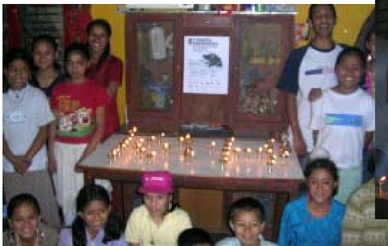
Desde Kathamandú hubo un recuerdo muy especial para todos