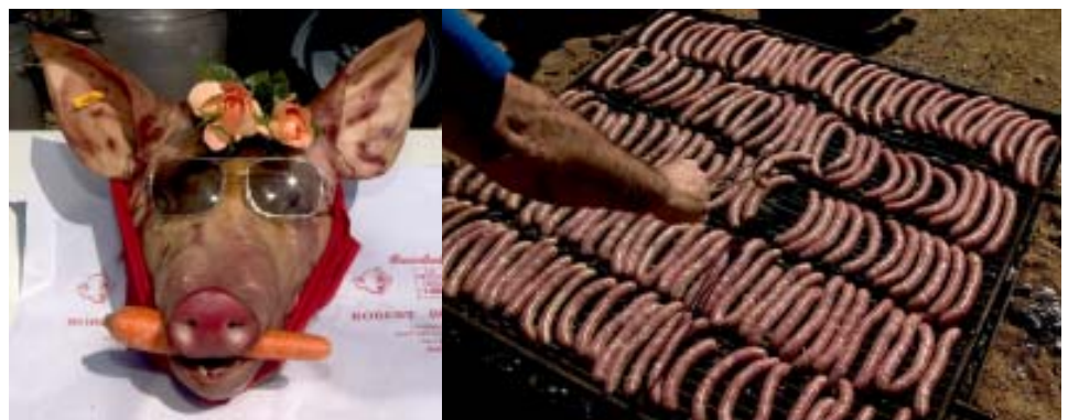
La charcuteria y los charcuteros son parte de la fiesta