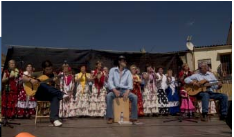
Las actuaciones musicales se sucedieron sin descanso