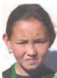
LaliMaya Bloon Patap